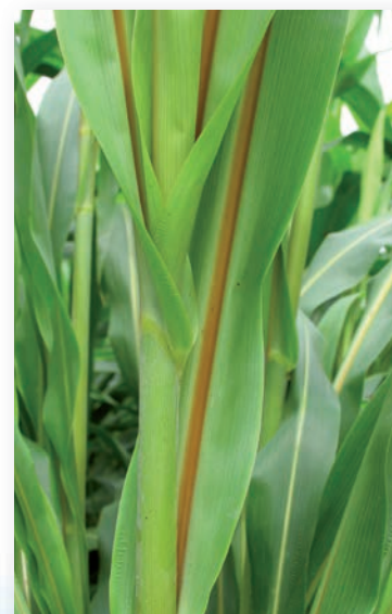
BMR = nervure brune centrale